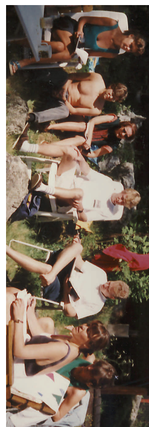
BILDER I MARGINALEN: Säljmöte WP.