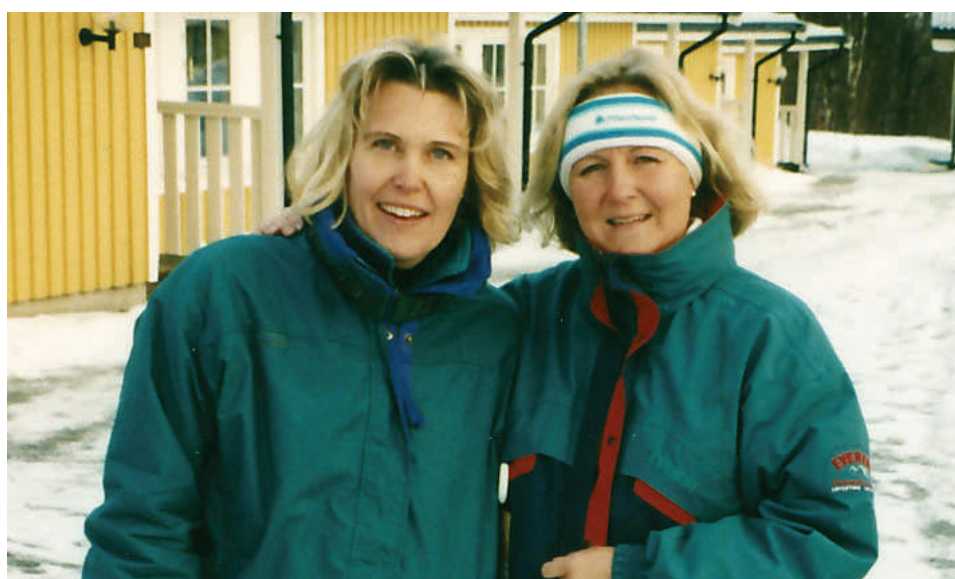
BILD 1: Chefstrion på France Telecom, likt musketörerna praktiserade de "en för alla och två för en". BILD 2: Kick-off i Åre 1997.

"...optimistjollar kan vara bångstyriga och svåra att hantera i alla fall när det inte blåser och styrfarten är obefintlig."