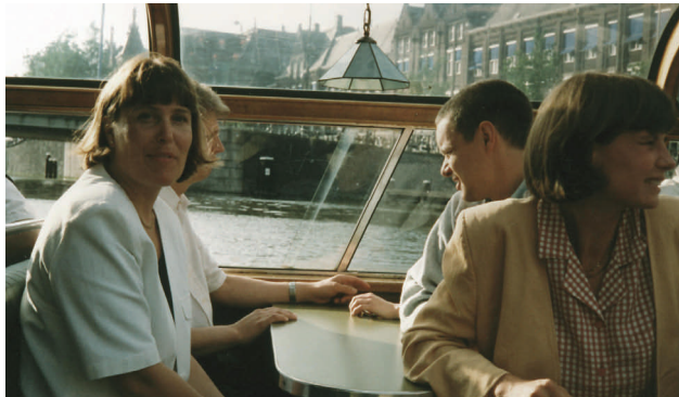
BILD: På en kanalbåt i Amsterdam.